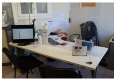
EFS de Chalindrey

03 25 88 46 43 efs.blb[at]ccsavoirfaire.fr